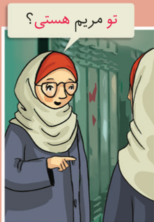
تو ..... هستی.