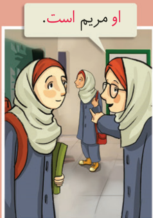
او ..... است.