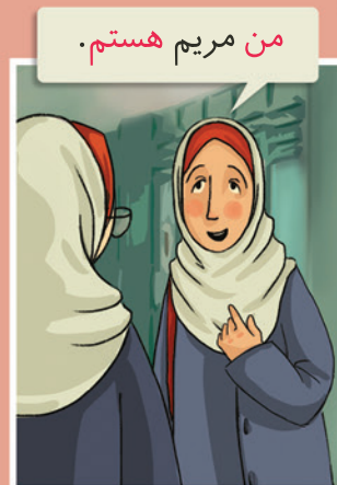
من ..... هستم.